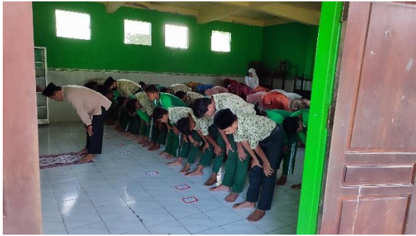
FOTO EKSTRAKURIKULER DAN KOKURIKULER